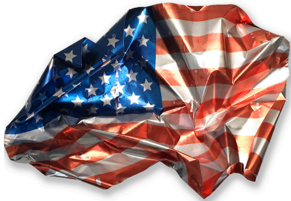
Werk: CRUMPLE FLAG V, 2022, Pigmenttransfer, Aluminium, 122 x 85 x 26 cm.