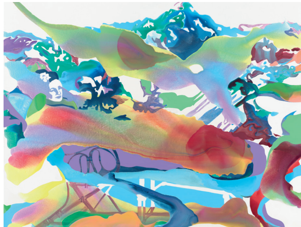
Werk: Mme Chauchat, 2022, Tusche, Acryl und Öl auf Leinwand, 180 x 220 cm.