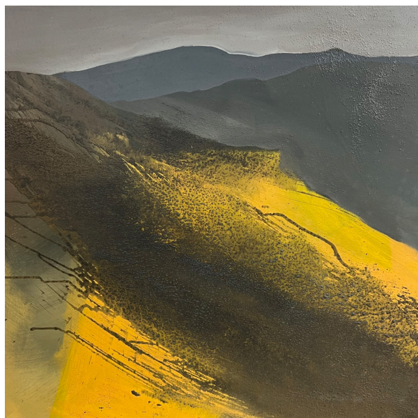
Werk: Imaginary Landscape nr 1, 2010, Acryl auf Leinwand, 80 x 80 cm.

www.art-center-berlin.de facebook.com/artcentergalerieberlin @art_center_berlin